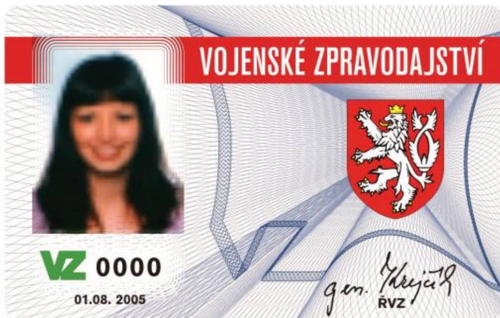
Obrázek 1. - Přední strana:

Zadní strana služebního průkazu je provedena v základní modré barvě s černými texty. Bílé okno pod horním okrajem je určeno pro titul, jméno a příjmení držitele průkazu. Pod tímto oknem je bezpečnostní giloše v modré barvě stylizovaná do vzájemně propojených opakujících se písmen VZ. Pod bezpečnostní giloší jsou uvedena slova: „Nálezce se žádá, aby služební průkaz odevzdal na nejbližší služebnu Policie České republiky nebo vojenský útvar.“.